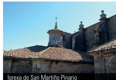
Igrexa de San Martiño Pinarío

No marco do programa de restauración de monumentos do Consorcio de Santiago, o organismo acaba de licitar varias obras. Na igreja de San Martiño Pinarío vanse reparar as cubertas das capelas; na igreja de San Frutuoso intervira no tellado, limpanse as fachadas e o campanario; e na capela de Santas Mariñas de Sar reparase o tellado, renovase a pintura das fachadas e reparase o revestimento de madeira do muro á rúa.